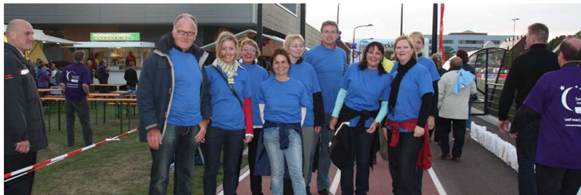
Het team van het Oncologiecentrum MUMC+ en onderzoeksinstituut GROW liep ook mee.